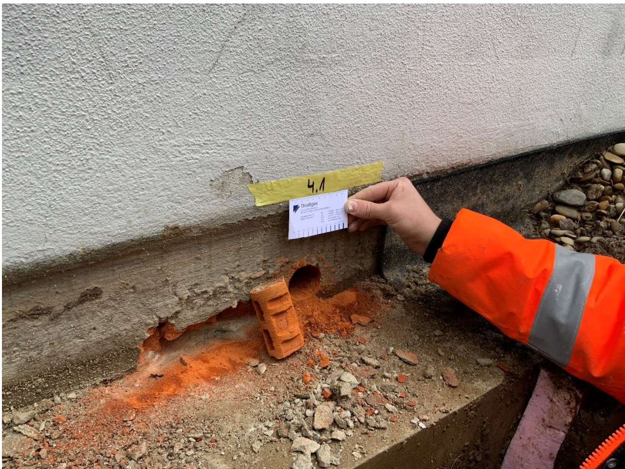
Abb. 11: Messachse 4