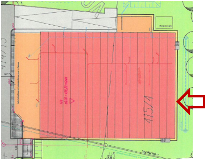
Abb. 8: Lage Messachse 3, Südseite