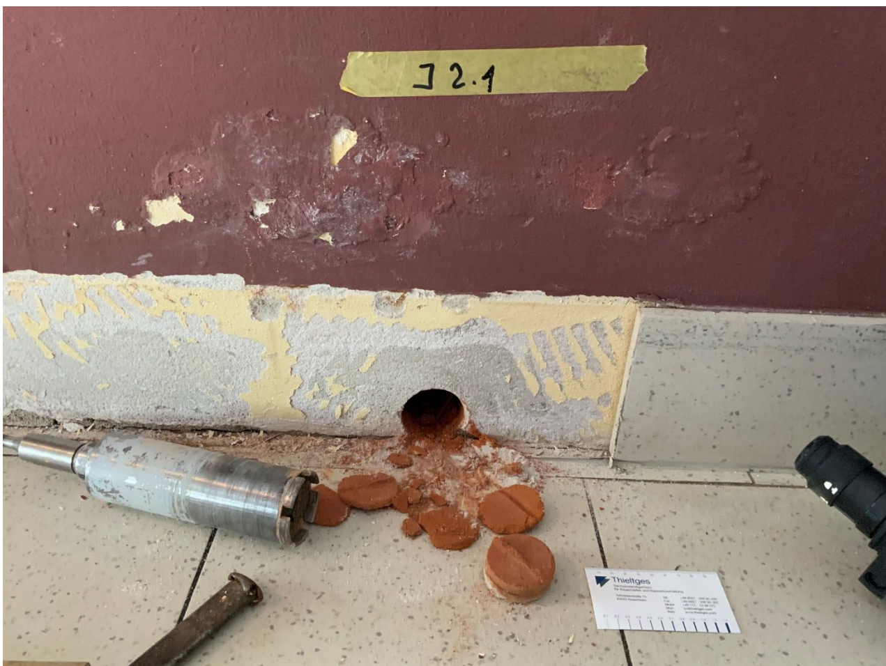
Abb. 6: Messachse 2 (innen)