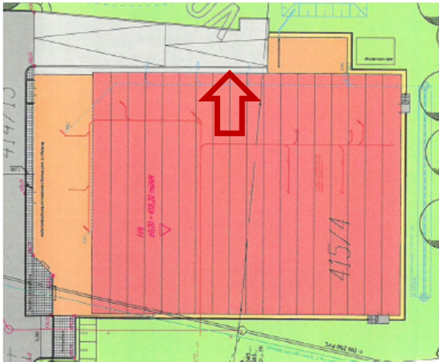
Abb. 3: Lage Messachse 1 (innen), Ostseite