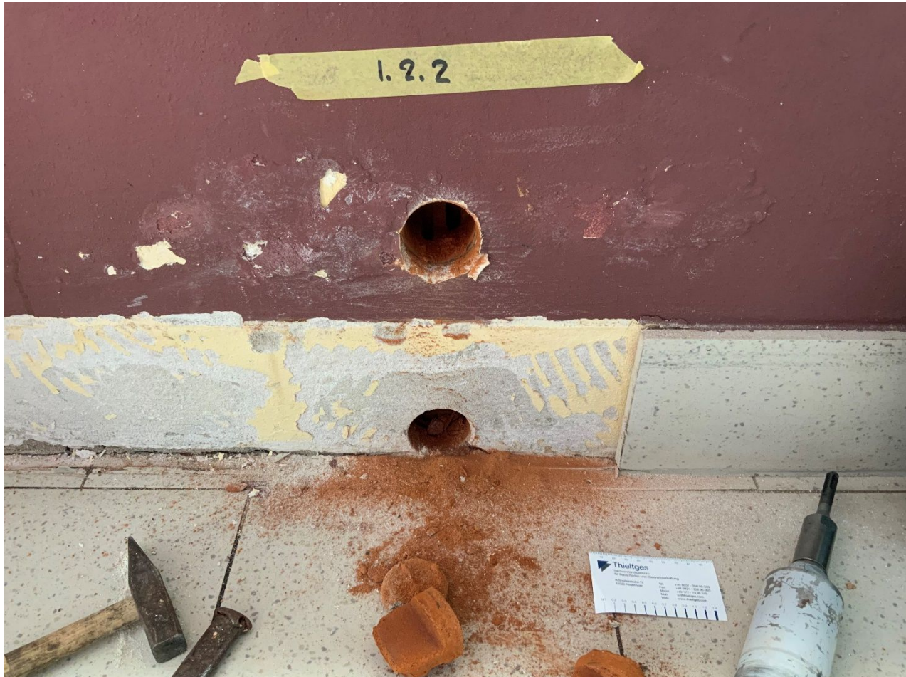
Abb. 7: Messachse 2 (innen)