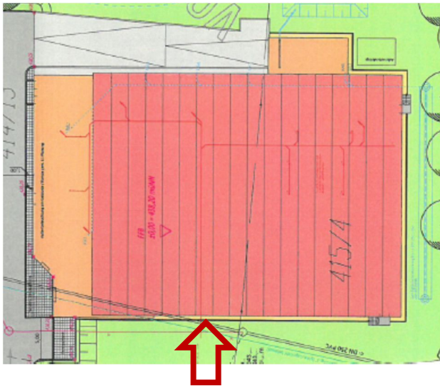
Abb. 10: Lage Messachse 4, Westseite