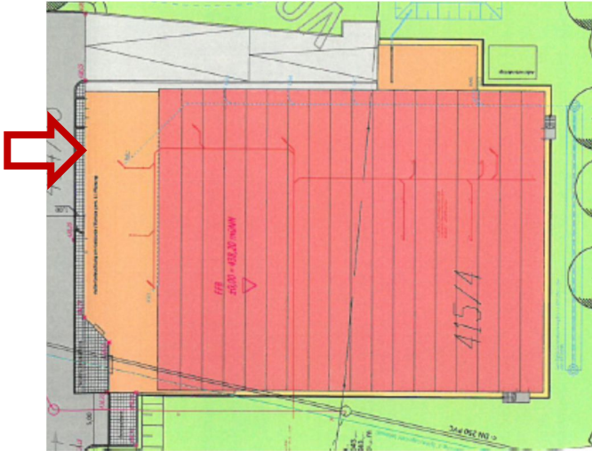
Abb. 1: Lage Messachse 1, Nordseite