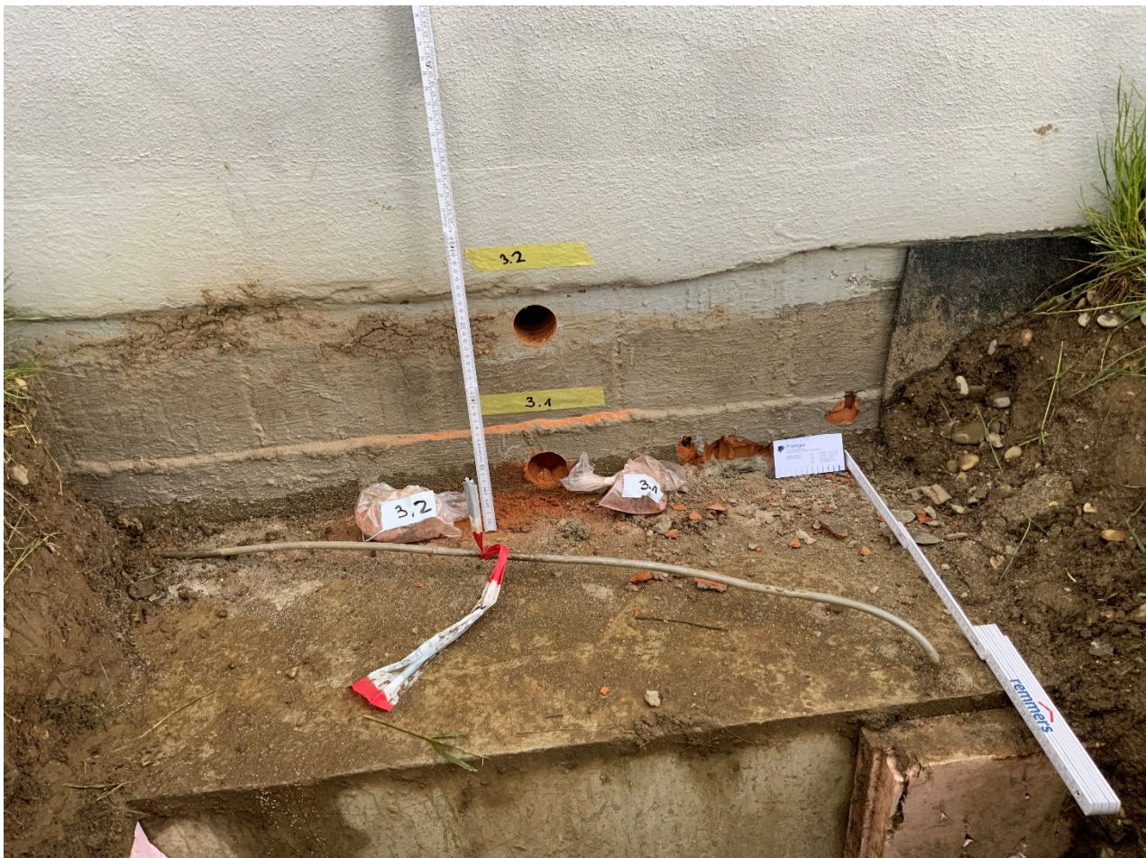
Abb. 9: Messachse 3