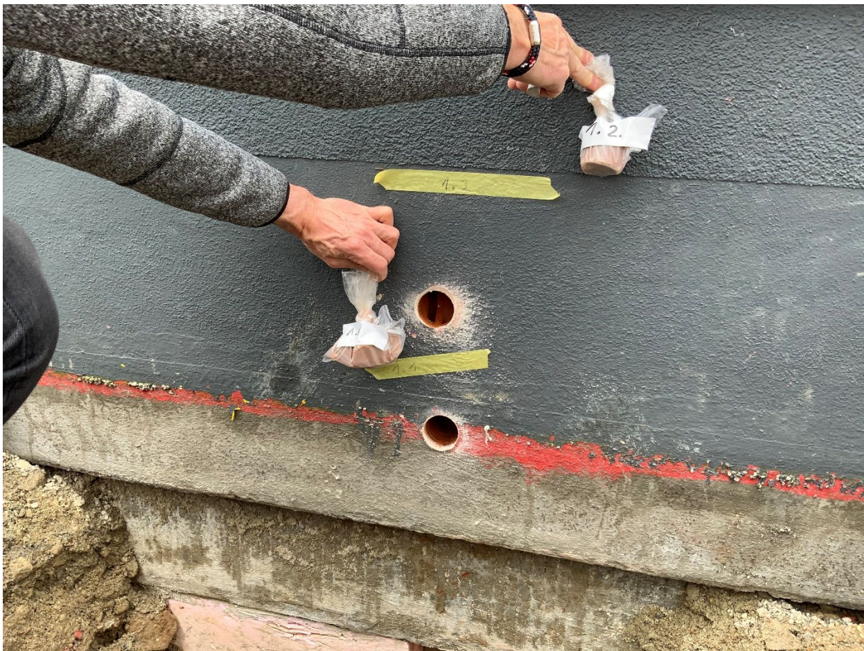
Abb. 2: Messachse 1